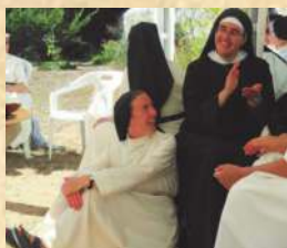
Accueil chez les Augustines