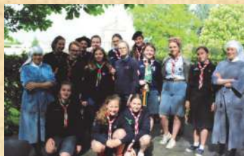
Accueil d'un groupe de guides