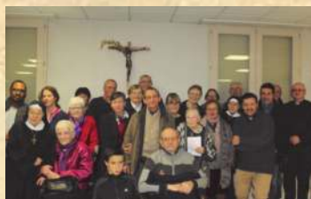
Rencontre avec la fraternité