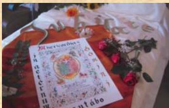
Jubilés de diamant

sur : les Appels divins , organisée à Saint Pern. Chacune est revenue profondément touchée par cette expérience d'enrichissement et de formation du cœur, dans un cadre très propice. Que les Petites Sœurs des Pauvres en soient particulièrement remerciées.