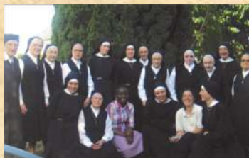
Avec les Augustines à St Louans