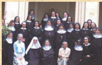
Journée des Prieures à Solesmes

C'est en effet une consolation pour toute Servante des Pauvres que de percevoir les fruits de son humble travail, par exemple lors de demandes de Sacrements, par le