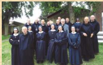
Les moines de Wisques à Denain