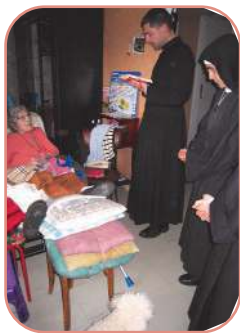
Service des malades à Meyzieu