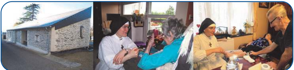
Centre de soins rénové à la Maison Mère et service des malades en nos maisons de Meyzieu et Jemappes