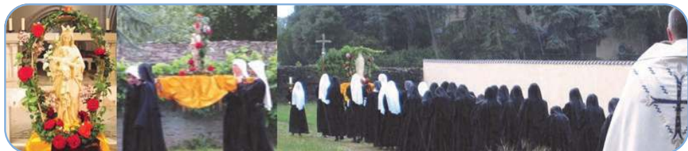
Procession du 15 août