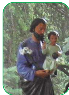
Saint Joseph veille sur la prière des sœurs

La nouvelle ‘pousse’ de la Congrégation, plantée en terre lyonnaise, à Meyzieu , et placée sous le patronage du saint Curé d’Ars, prend lentement racine et a fêté son 1 er anniversaire le 8 décembre. Le petit trio de Servantes des Pauvres qui la com-