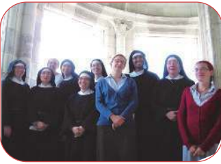
Le noviciat en sortie