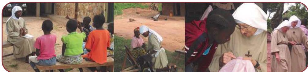
Mission au Congo

Nous n'oublions pas tous ceux qui, infirmières,