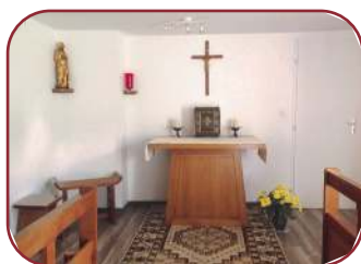
Chapelle de la Maison Saint Jean Marie Vianney, de Meyzieu