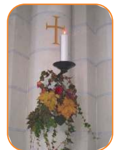
Anniversaire de la dédicace de la chapelle

Et en cette 'année de grâce' 2014 ? Avec nos 140 ans d'âge, espérons que la jeunesse du cœur et le zèle apostolique n'ait pas pris de rides. La joie et la générosité de nos jeunes sœurs à répondre à l'appel du Christ et à mettre leurs pas dans ceux de leurs anciennes nous le laisse espérer. Du côté du noviciat , la floraison des vocations est loin d'atteindre la montée en flèche des premières décennies ; néanmoins, la porte n'a jamais été fermée depuis, et si la relève n'égale pas toujours le nombre de Servantes des Pauvres qui, chaque année, vont grossir notre communauté du ciel, elle entretient notre espérance. Ainsi, depuis janvier, trois novices ont prononcé leurs premiers vœux et