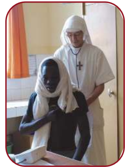
Dispensaire de Keur Moussa (Sénégal)