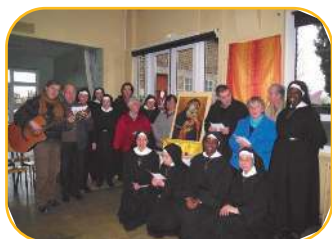
Rencontre de la fraternité à Denain