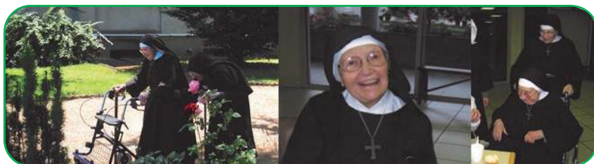
Scènes de vie à Massabielle