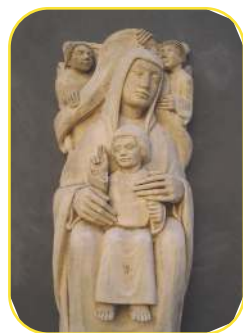
Pose de la nouvelle statue de Notre Dame