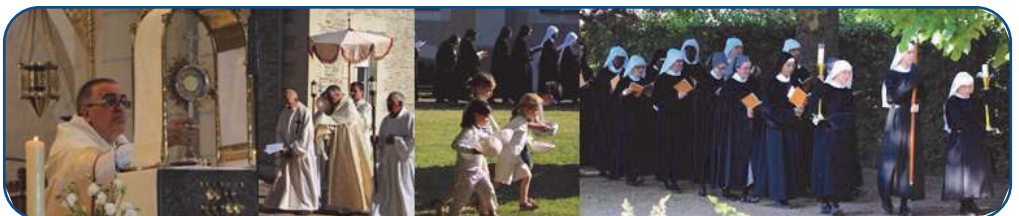
Procession de la fête –Dieu

Nous rappellerons encore que cette formation, jamais achevée, est poursuivie sous diverses formes par toutes les Servantes des Pauvres, y compris celles du moyen-âge et du grand âge, ces dernières n'étant pas les moins empressées à consacrer quelques heures chaque semaine à l'étude d'un thème donné à toute la Congrégation ! Il en va de même pour les prédications de nos retraites annuelles qu'elles ne voudraient manquer pour rien au monde et qui ont été assurées cette année : la 1 ère , par Mgr Bagnard ; la