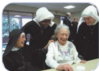
Rencontre de la fraternité à la Maison Mère

pose présentement et attend d'être renfloué, se donne à plein au service des malades et à celui des enfants d'un Patronage récemment créé par les prêtres de la paroisse, membres de la communauté Saint Martin.