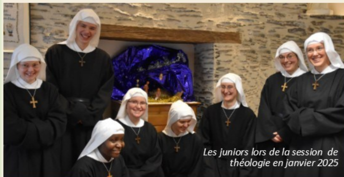
Les juniors lors de la session de théologie en janvier 2025

Sr Marie-Pia quant à elle reprend ses stages à partir de novembre pour terminer son internat de médecine.