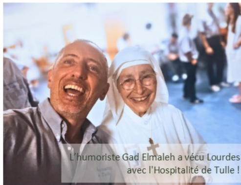
L'humoriste Gad Elmaleh a vécu Lourdes avec l'Hospitalité de Tulle !

Après trois ans de présence à Brive-la-Gaillarde, le nouvel évêque de Tulle, Monseigneur Éric Bidot, est venu bénir la première pierre de la chapelle dont la construction devrait s'achever d'ici juin 2026. Cette bénédiction enracine encore un peu plus les Servantes des Pauvres dans ce beau diocèse. La mission auprès des Pauvres malades s'affermi petit à petit et les motifs d'action de grâce sont nombreux : réception des sacrements en cette année jubilaire par plusieurs malades ou jeunes accompagnés par les sœurs, pèlerinage à Lourdes de sœur Colette-Marie avec l'Hospitalité corrézienne, admission de notre dernière junior à l'IFSI où elle a rejoint son aînée qui s'approche à présent du diplôme d'état... Autant de raisons d'espérer !