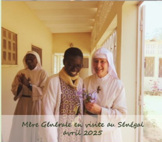
Mère Générale en visite au Sénégal avril 2025